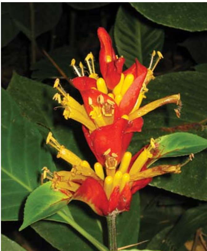
Sanchezia pennellii , especie focal en el agropaisaje de la cuenca del río La Vieja, Quindío, Colombia

Las especies focales son un conjunto de plantas que engloba las necesidades de una gama más amplia de especies, y que ayuda a determinar los atributos espaciales, de composición y de manejo de un paisaje para mantener poblaciones viables en el largo plazo (Lambeck 1997). El supuesto más importante del concepto es que las especies